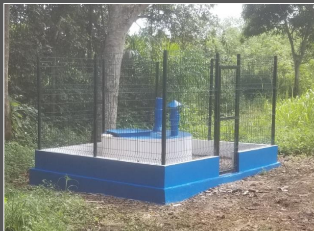
Reservatório de captação e armazenamento de água nascente do Rio Muembeji , bairro Monte Redondo reabilitado em N´Dalatando.

No âmbito do PIIM, a Empresa Tecnagri realizou trabalhos de reabilitação construção de vários chafarizes, lavandaria comunitária e ampliação da rede de abastecimento de água em alguns bairros no Município de Cazengo província do Cuanza Norte. Os trabalhos surgiram para melhoramento da rede de ligação e abastecimento de água em vários pontos de alguns bairros periféricos e não só, como também do projecto habitacional do Km 11.